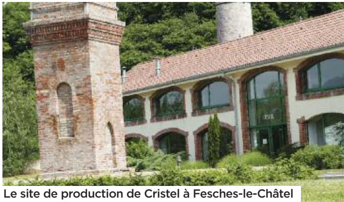
Le site de production de Cristel à Fesches-le-Châtel